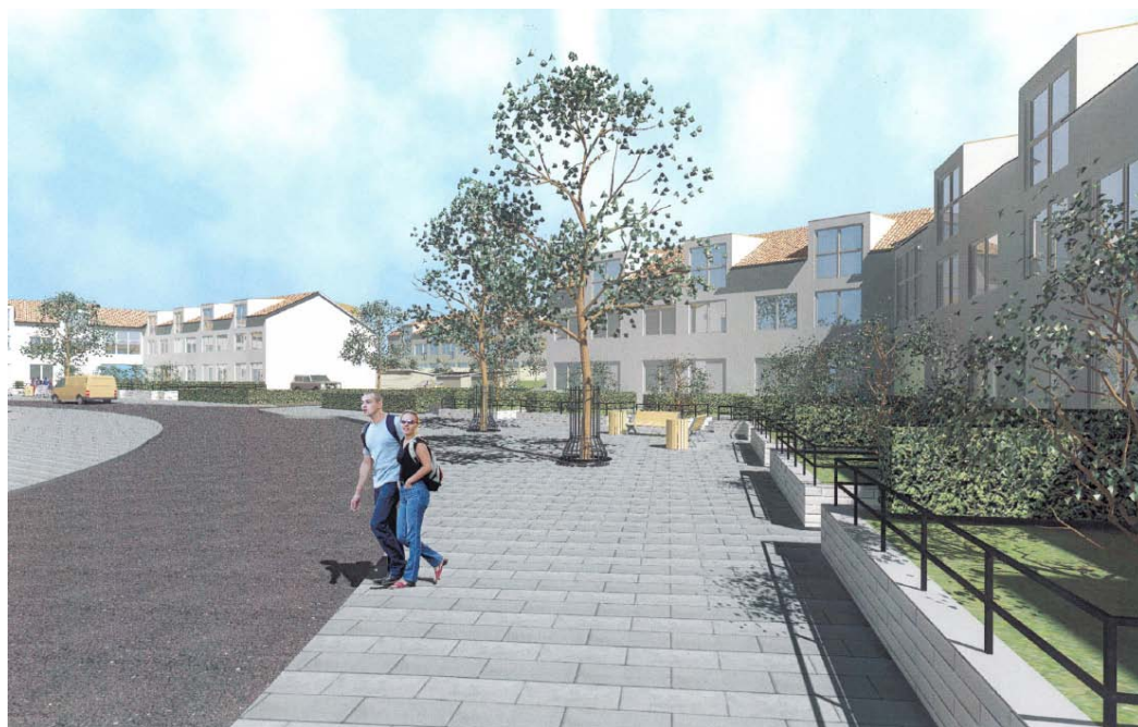
Perspektiv från vy 80, enligt förslaget ovan.