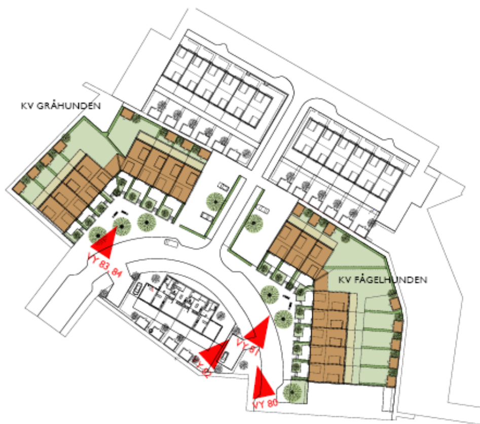
Illustrationsplan – utsnitt vid Vintbunds gatans norra del, enligt förslaget